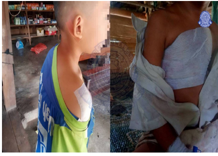
ဖဲ ၂၀၂၄ နံၣ် လိယုၤလဲ ၉ သီအနံၤန့ၣ် သုးမိစိရိအသုး (အိၣ်စုၤယၢၣ် သုးကျိၤ) ခၢကျိးဖးဒိၣ်အဃိ ဟံၣ်ဟးဂီၤ (၁၂) ဖျၢၣ်, ကမ့ၢ် (၃) ဂၤအကျိၤ ပုၣ်ဃုၣ်ဒိသ့ၣ် (၂) ဂၤဘၣ်ဒိဖဲ ထံမူထၣ်သဃီ, ဒုပုၣ်ဃုၣ်ဃိကီၢ်ရၣ်