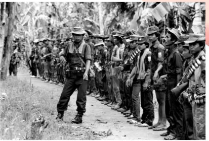
1984/26/03: Karen rebels form-up before probing Burmese Army positions