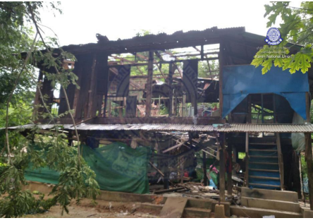
၂၀၂၄ နံၣ် လိယုၤလဲ ၄ သီတုၤ ၈ သီအတၢ်ပူၤ သုးမိစိရိအသုးတဖၣ်ခၢလီၤကျိးဖးဒိၣ်အဃိ ကမ့ၢ်ဘၣ်ဒိ (၂) ဂၤဒီး ဟံၣ်ဟးဂီၤ (၁) ဖျၢၣ်ဖဲ ချၢၣ်လွီၤထွၣ်ကီၢ်ရၣ်