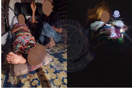
၂၀၂၄ နံၣ်လိယုၤလဲ ၁ သီတုၤ ၅ သီအတၢ်ပူၤ သုးမိစိရိအသုးတဖၣ်ခၢလီၤကျိးဖးဒိၣ်, ဒီးလီၤမ့ၣ်ဟီၤ, ခၢလီၤတၢ်လာဒြိအဃိ ကမ့ၢ်မိသဲဝဲ (၃) ဂၤ, ဘၣ်ဒိ (၅) ဂၤ ဒီး ဟံၣ်ဟးဂီၤဝဲ ၂ ဖျၢၣ်ဖဲ ချၢၣ်လွီၤထွၣ်ကီၢ်ရၣ်