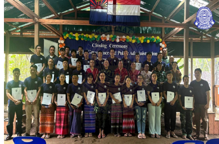
တၢ်တီၢ်ဒိၣ်ရီၣ်ဖဲ, တၢ်ဟတၢ်ပြး ဒီး တၢ်ဟဆၢရၢၣ်ကျိၤ ကမ့ၢ်တၢ်မၤလဲ ဘၣ်တၢ်မၤအီၤဖဲ မ့ၢ်တြီၢ်ကီၢ်ရၣ်, တၢ်မၤလဲယံဝဲ ၄ နံၣ် (၂၀၂၄ နံၣ်) အတၢ်ပူၤ