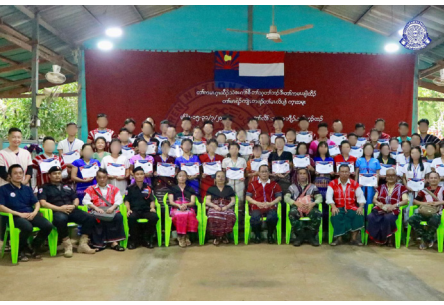
တၢ်မၤဂုၤထီၣ်သဲခးကီၢ်စိတၢ်သ့တၢ်ဘၣ်ဒိတၢ်ကမ့ၢ်ဖျါထီၣ်တၢ်မၤရၢၣ်ကျိၤ တဖၣ်တၢ်မၤလဲ ဘၣ်တၢ်မၤအီၤဖဲ (၂၀၂၄ နံၣ် လိယုၤလဲ ၁၅ သီ တုၤ ၃၁သီ)