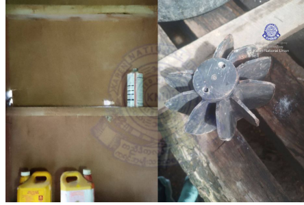
၂၀၂၄ နံၣ်လိယုၤလဲ ၃ ဒီး ၆ သီအနံၤန့ၣ် သုးမိစိရိအသုးတဖၣ်ခၢလီၤကျိးဖးဒိၣ်အဃိ ဟံၣ်ဟးဂီၤ (၆) ဖျၢၣ်, သီခဲဖျၢၣ်တၢ်သ့ၣ်ထီၣ်ဟးဂီၤ (၁) ဖျၢၣ် ဒီး ကမ့ၢ်မိစိတၢ်ပူၤဟးဂီၤ ၁ ဒိၣ်ဖဲ ဒုသထွၣ်ကီၢ်ရၣ်