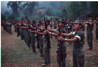
1991/12/01: Karen National Liberation Army (KNLA) soldiers on early morning parade in their Mar Ner Plaw stronghold