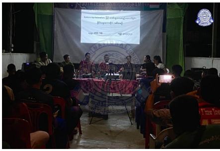
ကညိသးစၢ်ကရၢ ရၢၣ်ကျိၤမၤဝဲ Bottom-Up Federalism တၢ်တၢ် ဝီၣ်တဲသကီၢ်ဖဲ ကညိသးစၢ်ကရၢဝဲလီၤဒိၣ်သ့ၣ် (၂၀၂၄ နံၣ် လိယုၤလဲ ၃၀ သီ)