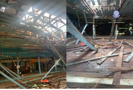
၂၀၂၄ နံၣ်လိယုၤ ၁ လါအတၢ်ပူၤ သုးမိစိရိအသုး တဖၣ်ခၢလီၤကျိးဖးဒိၣ်,ဟဲခၢလီၤတၢ်လာကတီၤယုၤ အဃိ ကမ့ၢ်ဟံၣ် (၄) ဖျၢၣ်, သီခဲဖျၢၣ် (၁) ဖျၢၣ် ဒီး တၢ်မၤလိကီၢ် (၁) ဖျၢၣ်ဟးဂီၤဝဲဒံၣ်ဖဲ မ့ၢ်တြီၢ်ကီၢ်ရၣ်