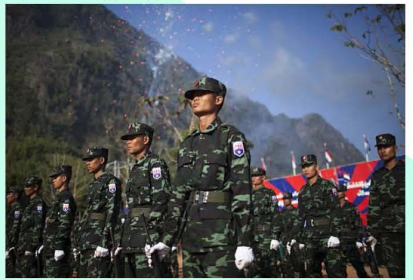
2019/31/01: 70 th Years Anniversary of Karen Revolution Day, Klo Yaw Lay, Bridge 7, Kawthoolei

တာဝန်ကြီး(၃)ရပ်ကို ထမ်းဆောင်ပြီး အထက်၌ ဖော်ပြသည့် အင်္ဂါလက္ခဏာရပ် (၆)ရပ်နှင့် ပြည့်စုံရန် ဖွဲ့စည်း တည်ဆောက်၍ ကရင်ပြည် ရယူရန်ဖြစ်သည့် ကရင်အမျိုးသား လွတ်မြောက်ရေးတပ်မတော်ဖြစ်သည်။