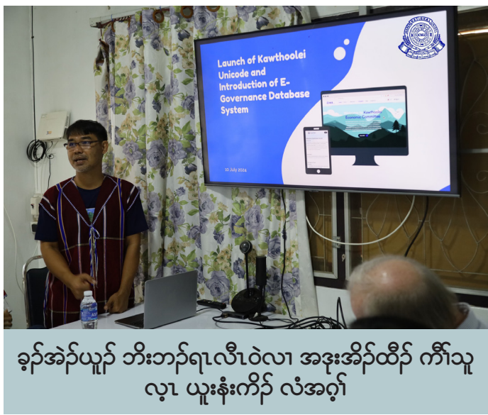
ခွဲအံ့ယုတ် ဘိးဘတ်ရုလီဝဲလဲ အဒုးအိတ်ထီပိ ကီသု လု ယူးနးကိတ် လဲအဂု

ဖဲ ၂၀၂၄ နံ လီယုလဲ ၁၀ သီအနဲန့တ် ခွဲအံ့ယုတ်-ကညီဒီကလုတ်စာ ဖိတ်ကရ ရဲကကျဲမာဝဲ တတ်ဘိးဘတ်ရုလီဒုးသုညီ ဘတ်ထွဲဒီးတတ်ဒုးအိတ်ထီပိ ကီသုလု ယူးနးကိတ် (Kawthoolei Unicode) အဂုအကျါန့တ်လီ။