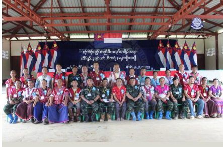
ဒုပုၣ်ဃုၣ်ဃိကီၢ်ရၣ် ၁၅ ဘၣ်တၢ်တုၤဒိကရဲး ဘၣ်တၢ်မၤအီၤဖဲ (၂၀၂၄ နံၣ်လိယုၤလဲ ၂၃ သီတုၤ ၂၅ သီ)