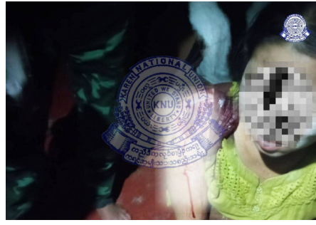
ဖဲ ၂၀၂၄ နံၣ် လိယုၤလဲ ၁၂ သီအနံၤန့ၣ် သုးမိစိရိအသုးတဖၣ်ခၢလီၤကျိးဖးဒိၣ်အဃိ ဘၣ်ဒိဝဲသဃီ (၂) ဂၤဖဲ သုၣ်တုၤလုၢ်သဃီ, ချၢၣ်လွီၤထွၣ်ကီၢ်ရၣ်