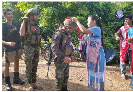
တၢ်တုၤလိာ်သဂၢ်သုးမ့ၢ်ဒိၣ်ဟံၣ်ကွၢ်လၢ တၢ်မိာ်ညါတၢ်ခးဖျါ တၢ်ရၢၣ်တၢ် ကျိၤ ဘၣ်တၢ်မၤအီၤဖဲ မ့ၢ်တြီၢ်ကီၢ်ရၣ် ချၢၣ်လွီၤထွၣ်ကီၢ်ရၣ် (၂၀၂၄ နံၣ် လိယုၤ ၁၀ သီ)