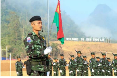
တပ်မဟာ (၆) ခု နှင့် မြစ်ဝကျွန်းပေါ်တွင် တပ်မ (၁) ခု၊ တပ်မဟာ (၆) ခု ဖွဲ့စည်းခဲ့သည်။

၁၉၅၂ ခုနှစ်တွင် အရှေ့ တပ်မ (၂) ခု၊ မြစ်ဝကျွန်းပေါ်တွင် တပ်မ (၂) ခုဖြင့် တိုးချဲ့ဖွဲ့စည်းခဲ့သည်။ KAF ဖွဲ့စည်းပုံမှာ အင်္ဂလိပ်တပ် ဖွဲ့စည်းပုံပေါ်တွင် အခြေခံသဖြင့် တော်လှန်ရေးနှင့် မကိုက်ညီသည်များလည်းရှိ၍ တော်လှန်ရေးကျသော တပ်မတော်တစ်ရပ်ကို ဖွဲ့စည်းရန် အခြေအနေက တောင်းဆိုသည့်အတိုင်း ၁၉၅၆ ခုနှစ်တွင် ကျင်းပသော ဒုတိယအကြိမ် အမျိုးသားညီလာခံက ကရင်တော်လှန်ရေး၊ စစ်ရေးလမ်းစဉ်နှင့်အတူ ကရင်လက်နက်ကိုင် တပ်မတော် တည်ဆောက်ပုံ၊ တပ်မတော်ဖွဲ့စည်းပုံများကို ရေးဆွဲချမှတ်၍ ၁၉၅၆ ခုနှစ် ဇူလိုင်လ (၅)ရက်နေ့တွင် ယင်း ကရင်တော်လှန်ရေး၊ စစ်ရေးလမ်းစဉ်နှင့် ကရင်အမျိုးသားလွတ်မြောက်ရေးတပ်မတော် ယခင် KPLA ယခု KNLA ဖွဲ့စည်းပုံကို အတည်ပြုသဖြင့် ထိုဇူလိုင်လ (၅) ရက်နေ့ကို ကော်သူးလေတပ်မတော်နေ့ (Karen National Liberation Army Day) ဟု ကျွန်ကရက်က ဆုံးဖြတ်လေသည်။