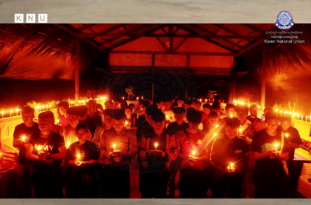
ဖဲ International Youth Day အမုၢ်နံၤန့ၣ် ကညိသးစၢ်ကရၢ မၤဝဲ တၢ်သ့ၣ်နီၣ်ထီၣ်သးစၢ်လၢလုၢ်ထီၣ်သးသမုၤလၢထံကီၢ်ဒီးကလုာ်ကီၢ်တဖၣ် အတၢ်ရၢၣ်တၢ်ကျိၤဖဲ ကညိသးစၢ်ကရၢလီၤခၢၣ်သး (၂၀၂၄ နံၣ် လိယုၤလဲ ၁၂ သီ)