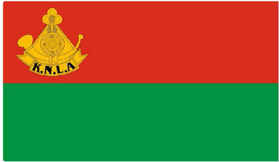
Karen National Liberation Army Flag

ကရင်လက်နက်ကိုင်တော်လှန်ရေးအတွက် KNLA ကို ကရင်အခြေခံ လက်နက်ကိုင်တပ်မတော်အဖြစ် ဦးစွာဖွဲ့စည်းခဲ့သည်။ KNLA ကို ဖွဲ့စည်းသည့်နည်းတရားချိန်တည်း အုပ်စိုးသူ ဖဆပလ အစိုးရလက်အောက်တွင် အမှုထမ်း ကြသော လက်နက်ကိုင်တပ်များ (ကြည်းတပ်၊ လေတပ်၊ ရေတပ်) အားလုံးကိုလည်း ကြိုးစားဆက်သွယ် စည်းရုံး ခဲ့သည်။